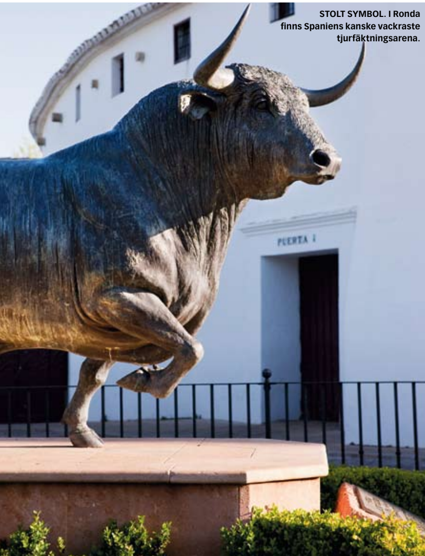
STOLT SYMBOL. I Ronda finns Spaniens kanske vackraste tjurfäktningsarena.