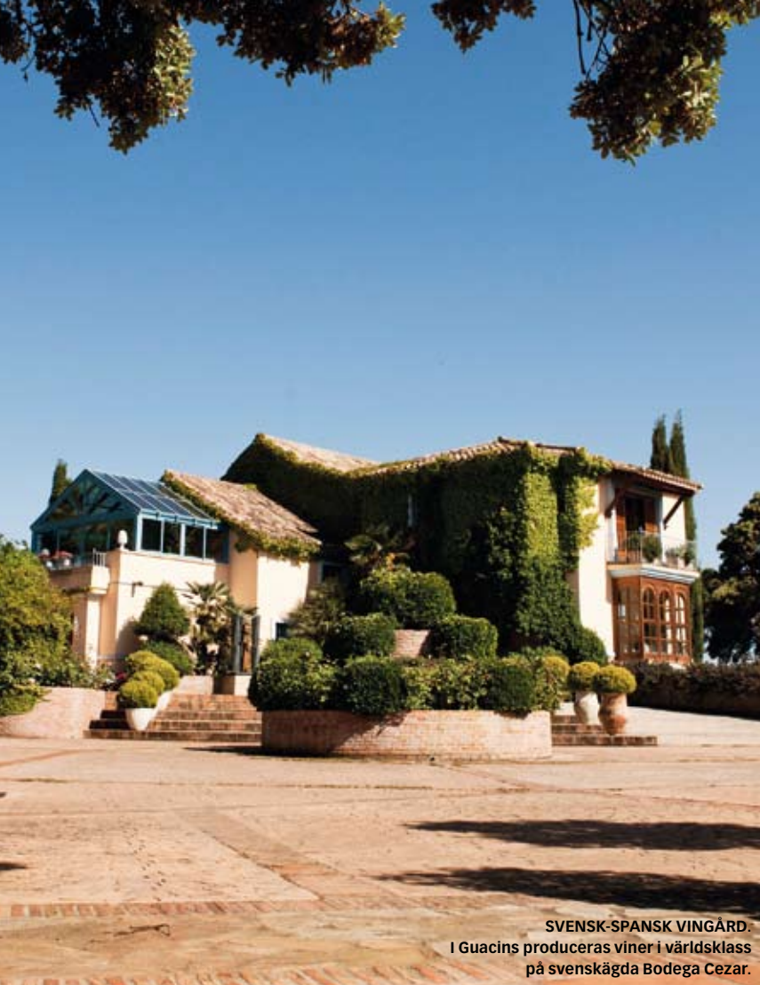
SVENSK-SPANSK VINGÅRD. I Guacins produceras viner i världsklass på svenskägda Bodega Cezar.