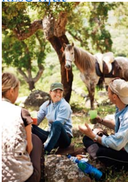
NYA VÄNNER. En ridtur med Caroline Seger på Aventura Equestre är ett äventyr i sig.