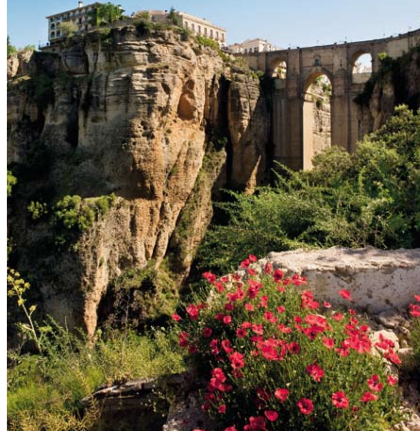
PONTE NUEVO är en av de broar som binder samman staden Ronda.