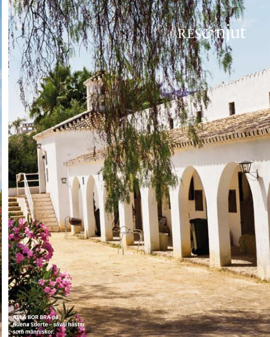
ALLA BOR BRA på Buena Suerte – såväl hästar som människor.