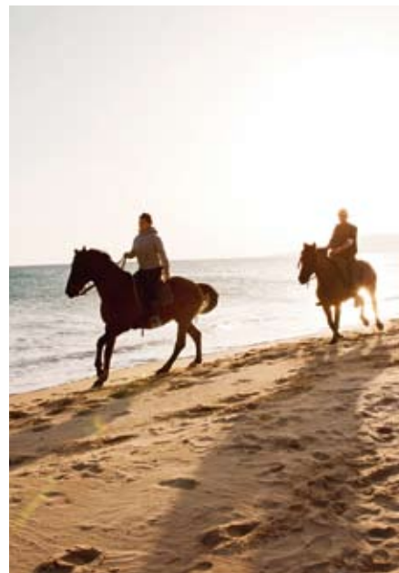
SNABB STRANDGALOPP på kilometerlånga Playa De Los Lances, vid Medelhavets rand.