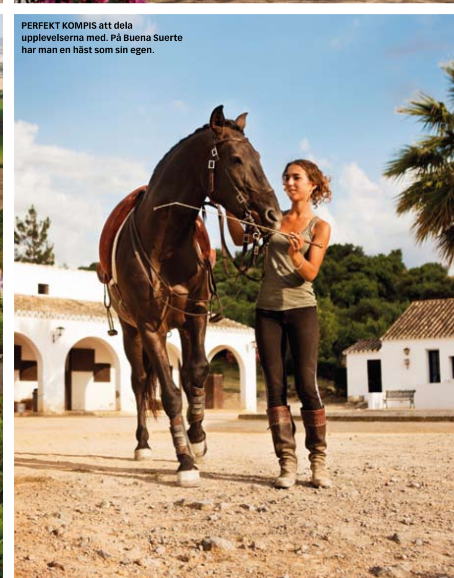
PERFEKT KOMPIS att dela upplevelserna med. På Buena Suerte har man en häst som sin egen.