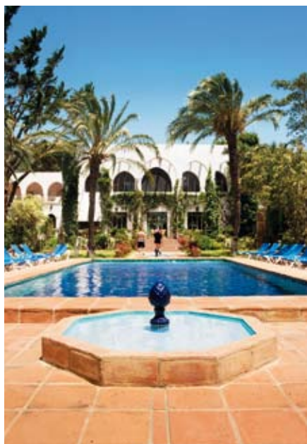
RELAXAD LYX på Hurricane Hotel i Tarifa, nära både stranden och hästarna.