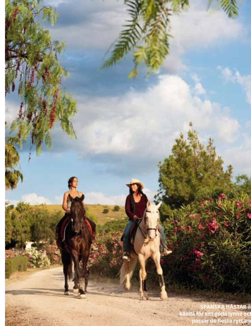
SPANSKA HÄSTAR är kända för sitt goda lynne och passar de flesta ryttare.